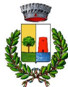
Comune di Bari Sardo