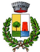
Comune di Bari Sardo