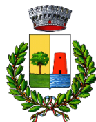
Comune di Bari Sardo