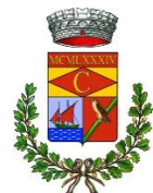
Comune di Cardedu