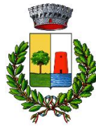
Comune di Bari Sardo