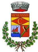
Comune di Cardedu