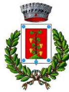
Comune di Elini