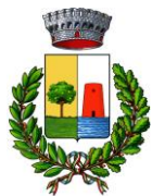
Comune di Bari Sardo