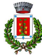
Comune di Elini