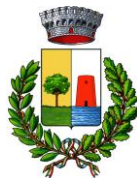
Comune di Bari Sardo