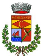
Comune di Cardedu