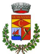
Comune di Cardedu