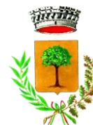
Comune di Loceri