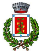
Comune di Elini